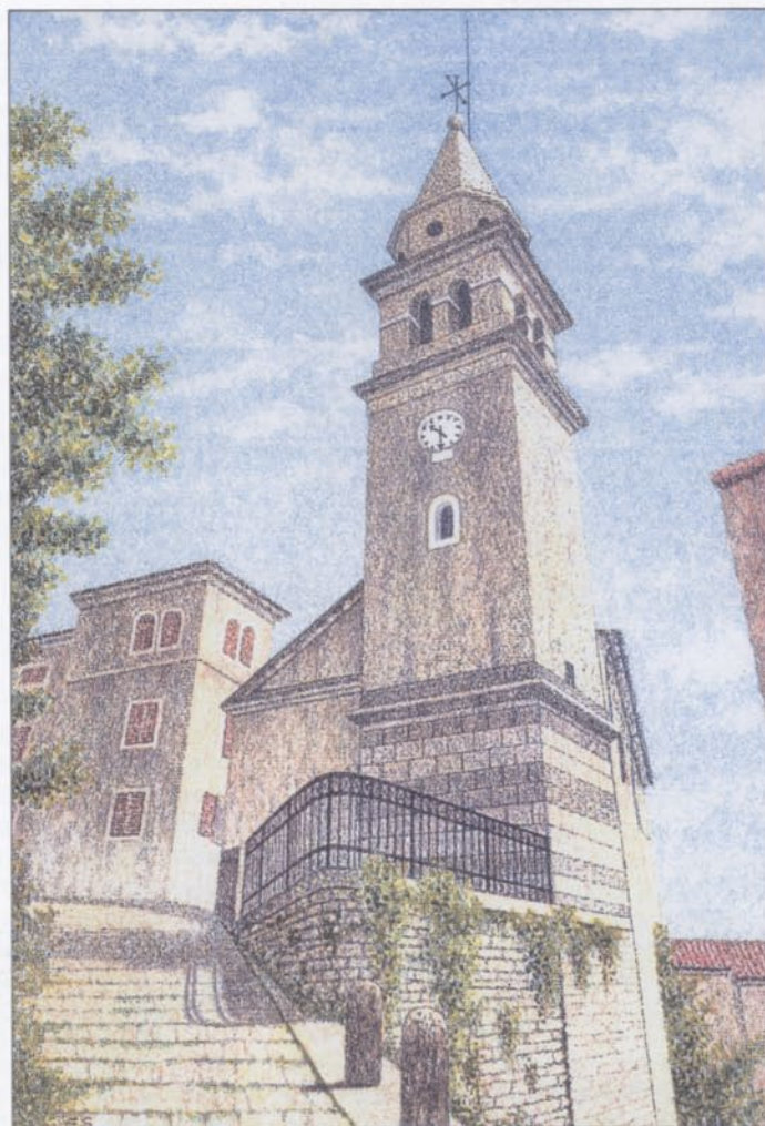
Montona - Chiesa della Madonna delle Porte, costruita nel 1520, dedicata a San Giovanni Battista

Il movimento fascista raccolse ed organizzò le varie forze nei fasci di combattimento, che lentamente ebbero ragione delle bande ispirate al bolscevismo. Con l'avvento di Mussolini al potere, nel rispetto della democrazia e della Costituzione, ebbe inizio un governo sorretto dalla Monarchia, dalla Chiesa, dalla grande industria, dalle Forze Armate, che vedevano con terrore il prevalere del bolscevismo (comunismo leninista) in Italia. La debolezza dei partiti di allora, imbelli, incapaci di reazioni forti e di prospettive a valenza nazionale, facilitò l'ascesa del fascismo. Il delitto Matteotti (anno 1924) a torto attribuito a Mussolini, che proprio in quel periodo tentava