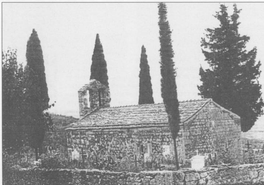
La chiesa di San Nicola a Raccotole

La caduta di intonaco da vari punti dell'affresco stesso non ci permette di apprezzarlo completamente, ma la padronanza del pennello, che si riscontra nell'evidente effetto tridimensionale delle opere