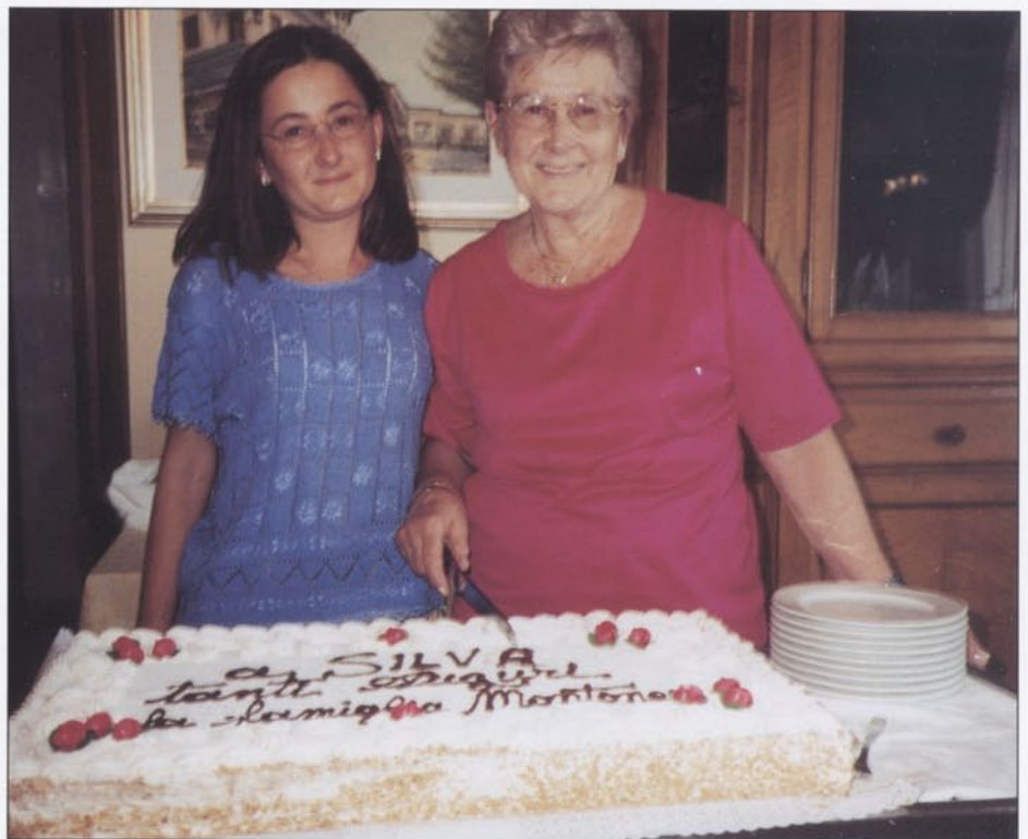
La nostra Silva festeggiata per il suo compleanno, con la figlia, mentre taglia la torta.