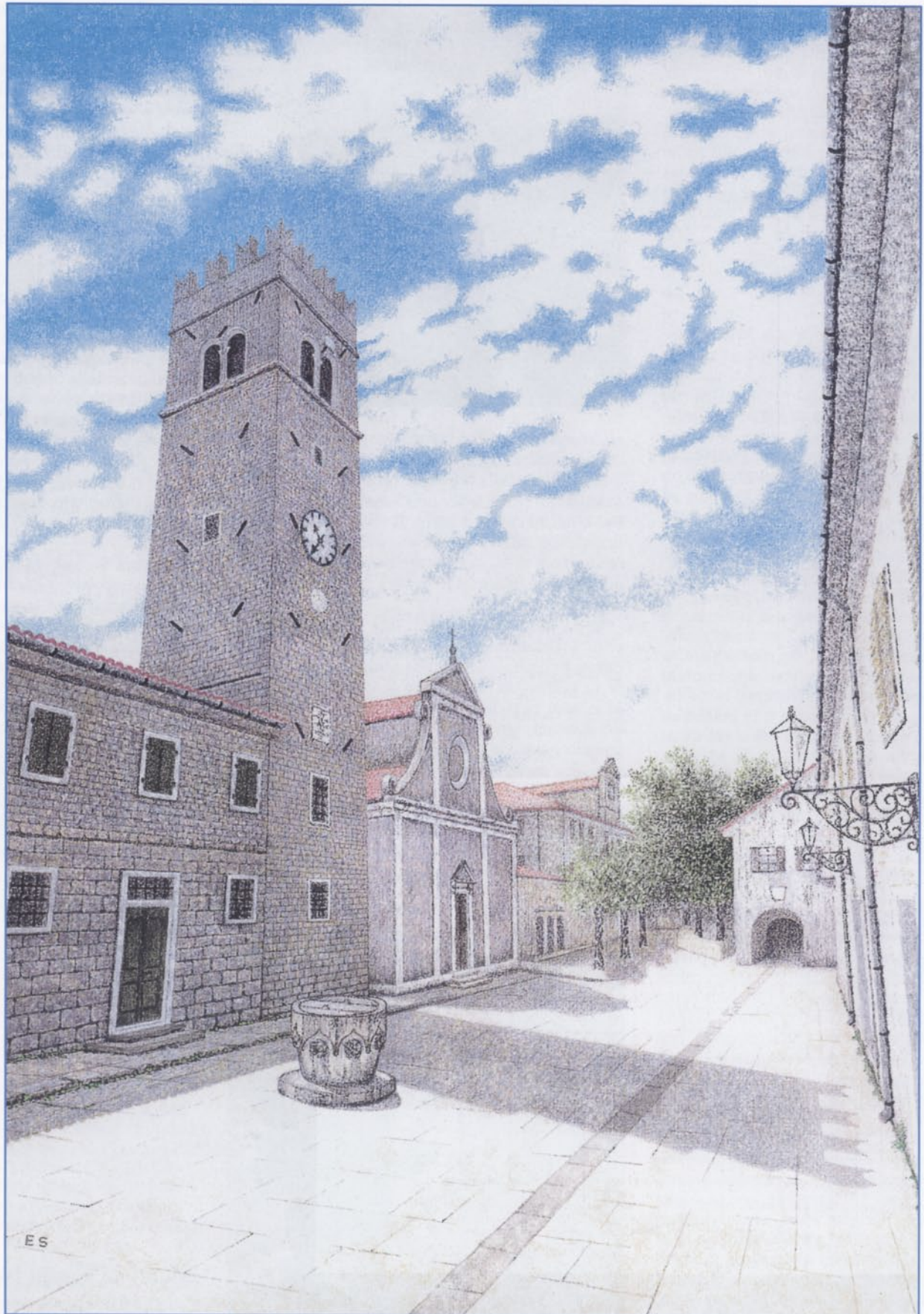
Piazza de sora (Andrea Antico), Torre campanaria (sec. XIII) e Duomo