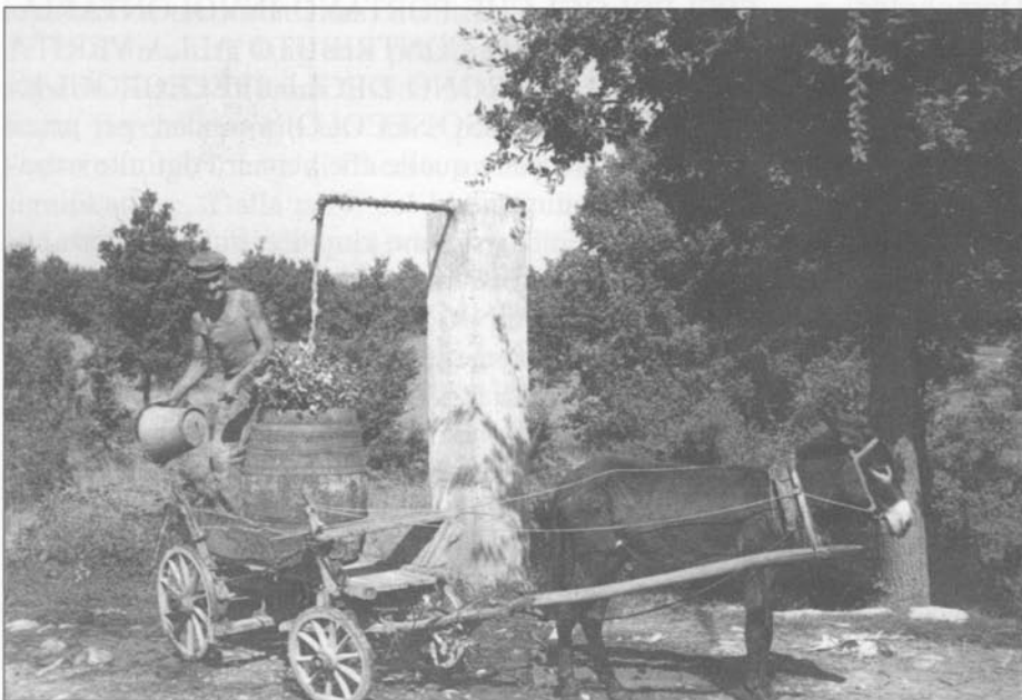
Zona di Buie, nel dopoguerra. Un contadino fa rifornimento d'acqua