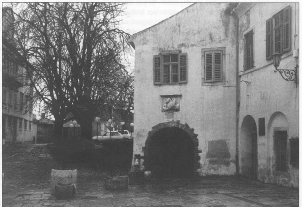
Montona, tardo autunno. Il leone veneto fa buona guardia

Renderà senza dubbio felici i nostri palati, un po' meno la linea.