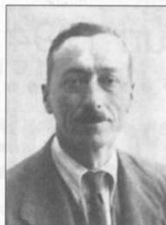
Giovanni Paoletti 46.o anniversario della morte