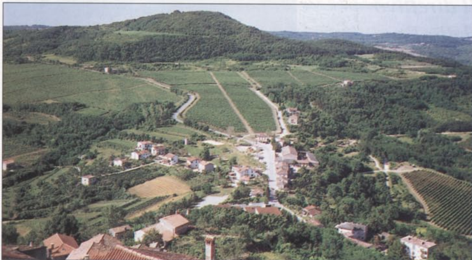
Veduta dalle Mura: il Laco, bivio per Caroiba e San Pancrazio con il monte Subiente

Non dimentichiamo che per moltissimi parenti, discendenti dei martiri scomparsi, vittime di un oscuro periodo di moderna barbarie, l'iscrizione del loro caro negli elenchi dell'ALBO D'ORO costituisce l'unico monumento e riconoscimento, a futura memoria.