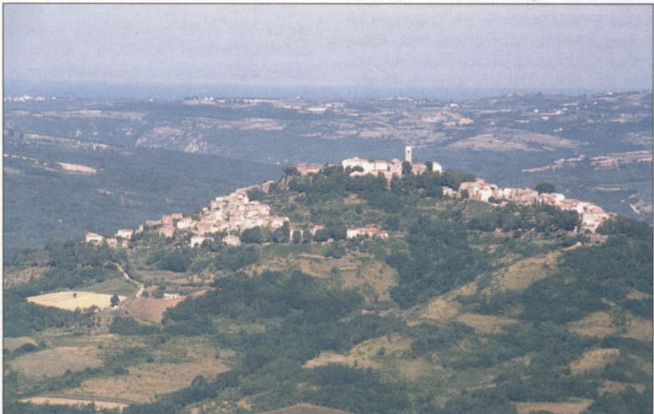
Montona vista da Zumesco, all'orizzonte l'Adriatico