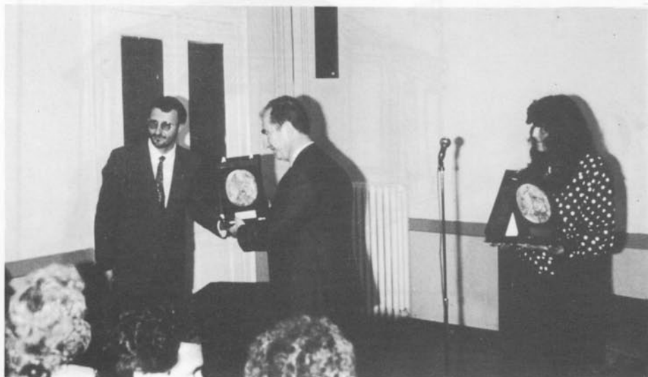
Il momento della premiazione.