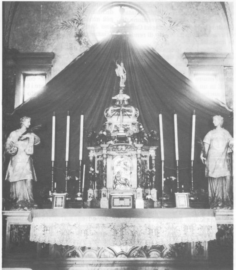
Duomo di Montona. L'Altar Maggiore con le Statue dei SS. Stefano e Lorenzo.

Così, dopo una serie di intimidazioni da parte del maresciallo, che arrivò a rispolverare le sue vecchie rivendicazioni su Trieste, a schierare i carri armati federali a Capodistria e ad accusare pubblicamente l'Italia di non meglio precisate "suggestioni fasciste" (sic), furono avviate in gran segreto le trattative che avrebbero portato al famigerato trattato di Osimo.