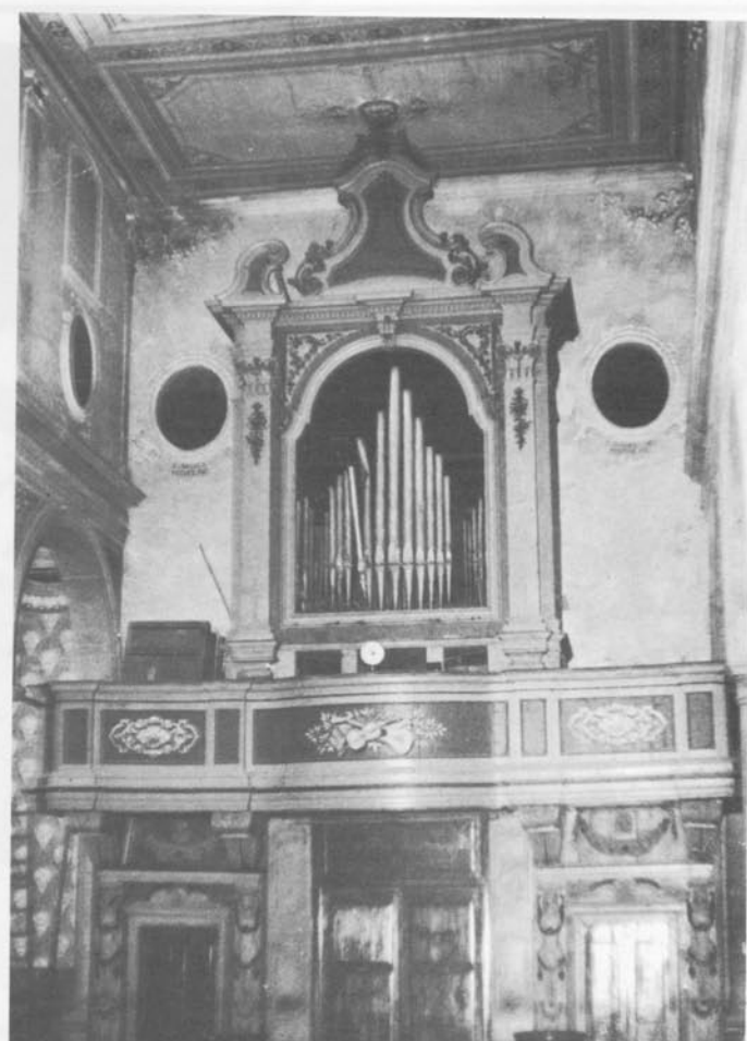
Duomo di Montona. L'Organo quand'eravamo noi.