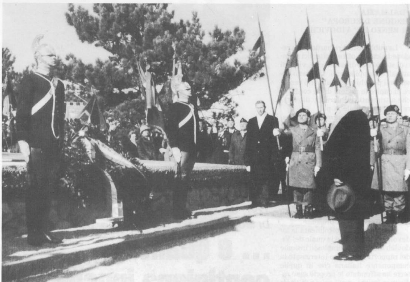
Il Presidente della Repubblica Italiana Scalfaro rende omaggio agli infoibati. Trieste 11/02/1993. Foiba di Basovizza.

Ricorre quest'anno il cinquantenario dei primi infoibamenti: le prime vittime di questa "pulizia etnica" ante litteram si ebbero infatti in Istria proprio nell'autunno del 1943.