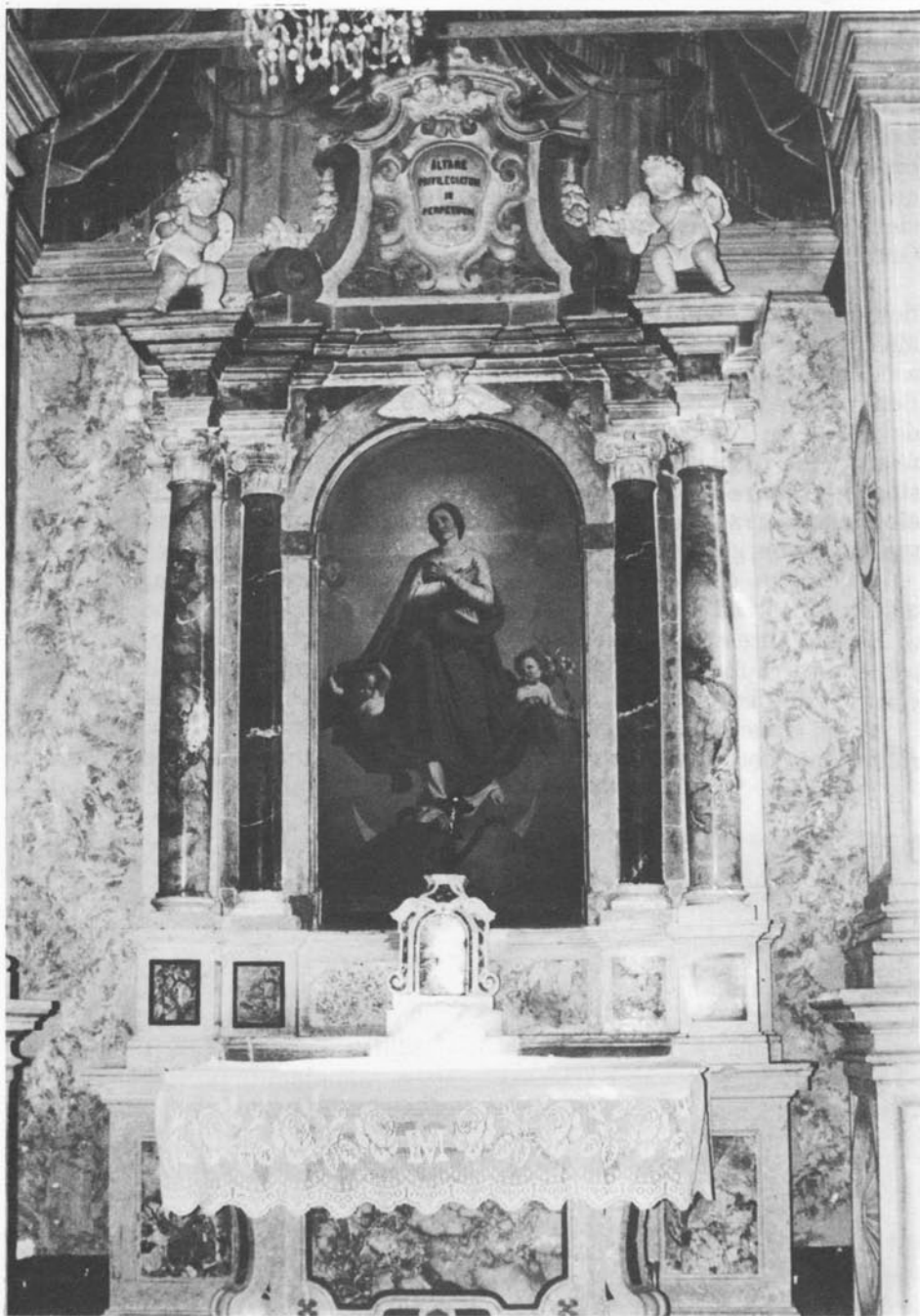
Duomo di Montona. L'Altare della Madonna.