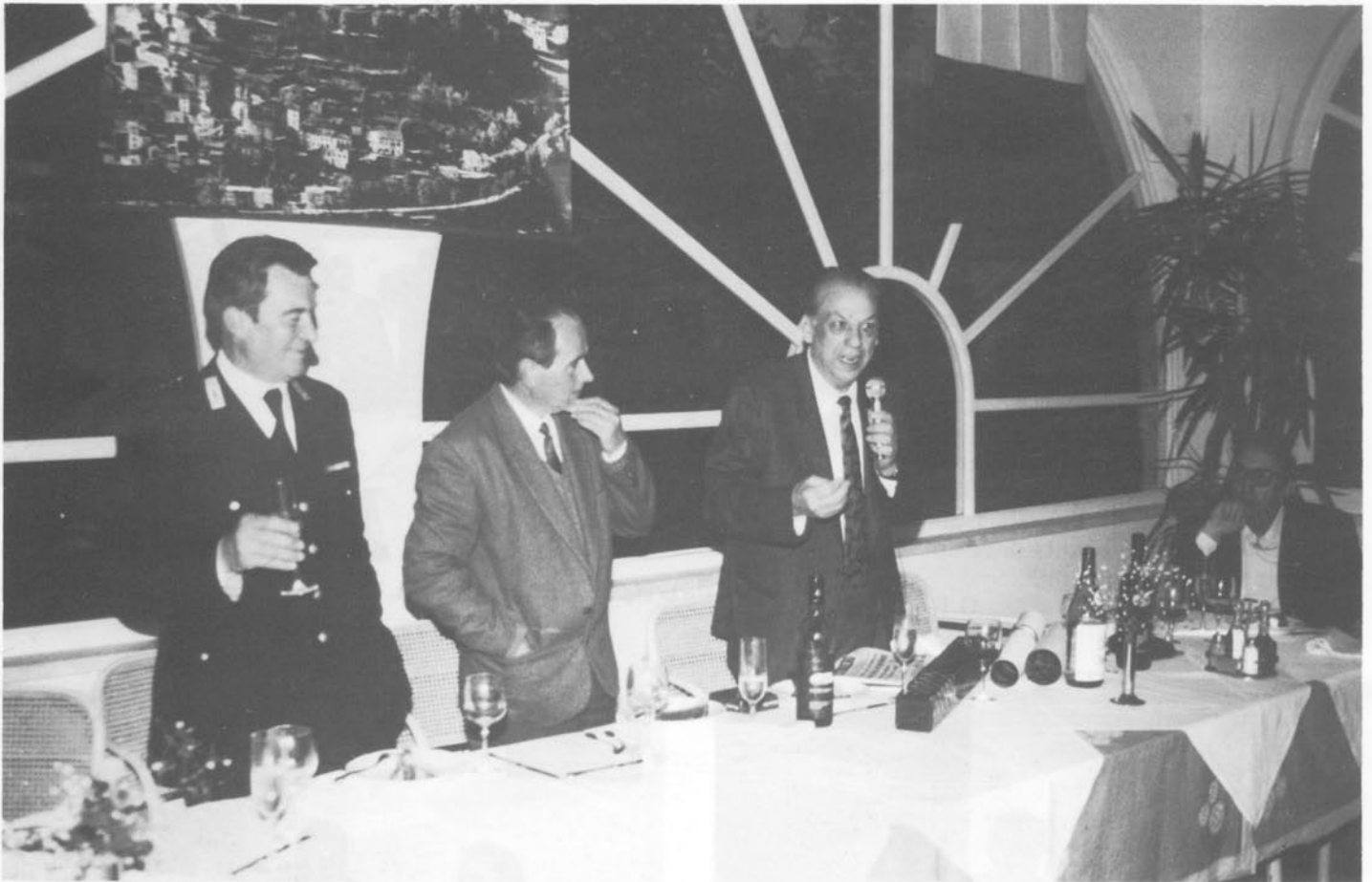
Il Presidente della Famiglia rivolge parole di saluto al Sindaco di Casciana Terme e al Comandante dei Carabinieri.