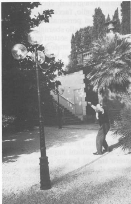
Questa volta Giovanin tira ai lampioni (si fa per dire...).