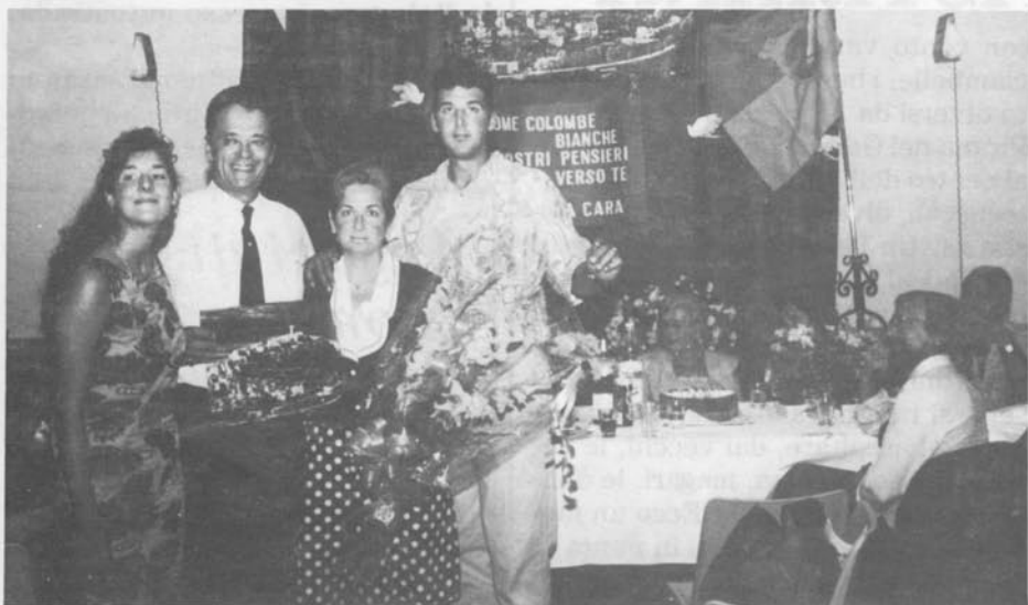
La famiglia Cresti con gli omaggi ricevuti dalla Famiglia Montonese.