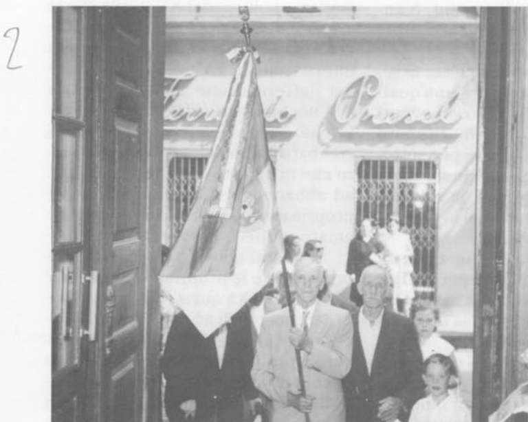
La Bandiera portata da "Palos" entra nella chiesa di S. Antonio.