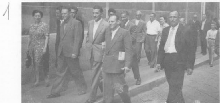
Montonesi che si avviano alla S. Messa.