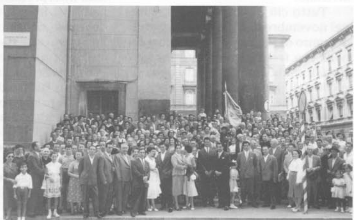
Il gruppo attorno alla bandiera dopo la S. Messa.