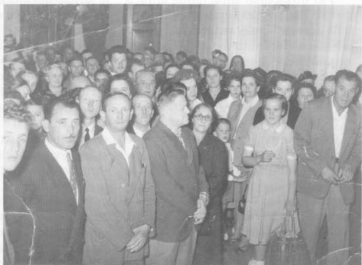
Nell'interno della chiesa.