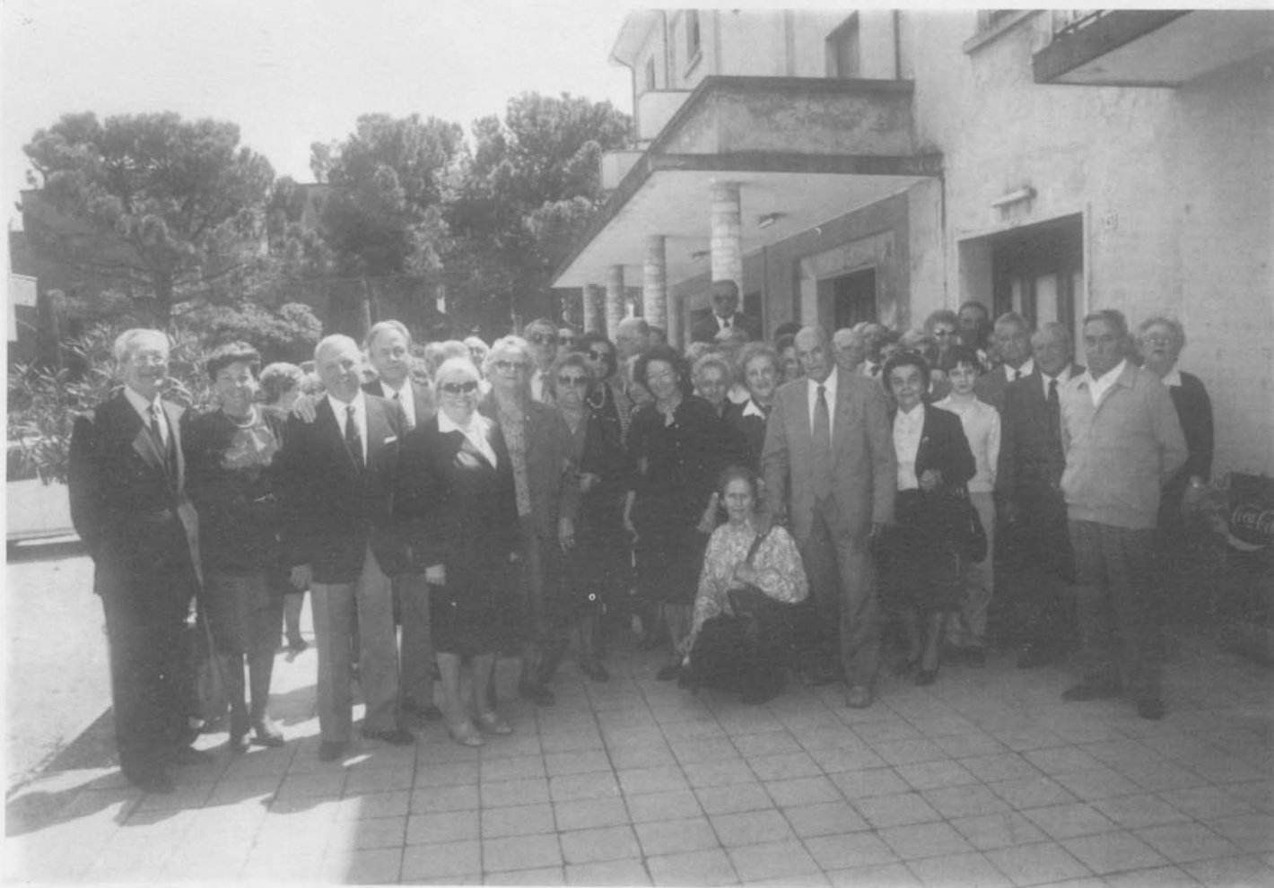
I partecipanti all'incontro posano all'entrata dell'albergo.