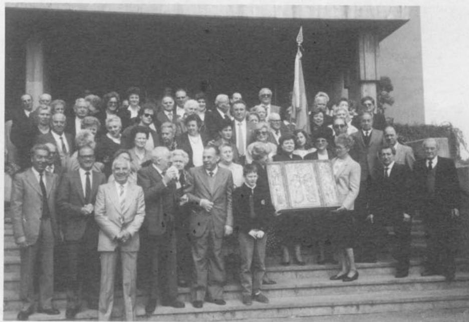
Dopo la S. Messa i convenuti con l'altarolo e la bandiera.

chiesa di Santa Caterina nella Zona Lucento, che è il rione degli istriani, fiumani e dalmati, ecco ad attenderci il grosso dei montonesi. Dopo i saluti, le