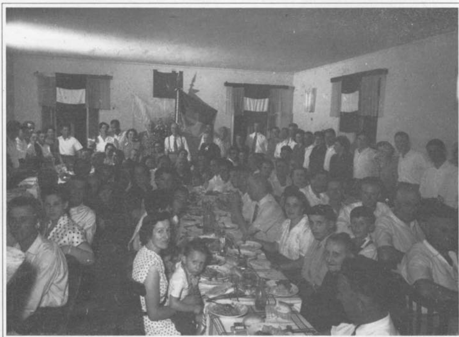
Trieste 1954, 1° Incontro di Montonesi esuli