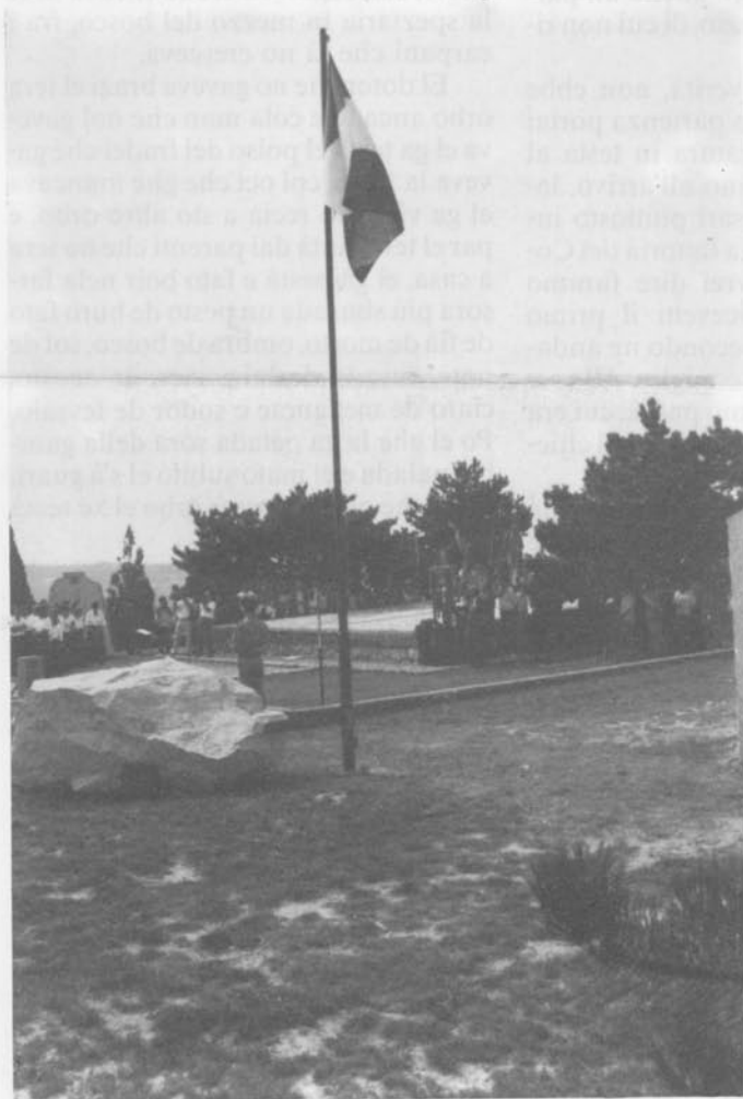
Foiba di Basovizza. Nel giorno del Raduno - 20 settembre 1987.