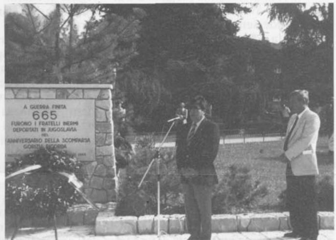
Ricordiamo il martirio di Gorizia.