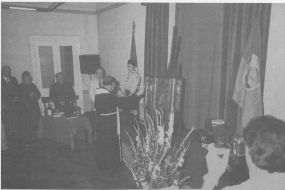
La benedizione dell'Altarolo.

quasi totale adesione non solo dei Montonesi, generosamente solidali, ma anche di altri Amici. L'idea di avere con noi e per noi il più qualificante degli oggetti sacri che costituivano il tesoro del Duomo di Montona è stata immediatamente accettata.