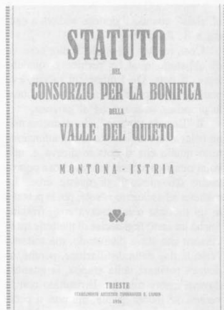
Foto copertina Statuto Consorzio

Possiamo invece immaginare che diverse ragioni, specie d'ordine finanziario, abbiano frenato le iniziative del Consorzio, che nei brevi anni relativamente tranquilli che precedettero il periodo bellico e il successivo esodo, non ha potuto portare a termine quanto sicuramente progettato. Indubbiamente i lavori maggiori sono stati compiuti a valle, verso Cittanova. Sicuramente il percorso del fiume, il cui alveo in buona parte si snodava nel bel mezzo del bosco di S. Marco, rendeva difficoltose e troppo costose le opere di allargamento e di bonifica. Sta di fatto che gli occupatori jugoslavi hanno preferito costruire, almeno nella valle di Montona, un canale artificiale a sud del fiume, fuori del bosco. Chi scrive sarebbe lieto che altri, ben più a conoscenza dell'argomento in causa, volessero farci dono di un articolo sullo stato dei lavori, sulla silenziosa e non facile ope-