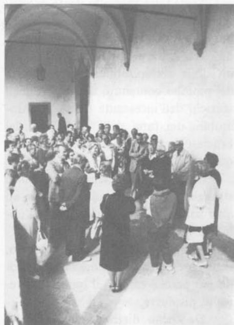
All'interno dell'Abbazia di Praglia.