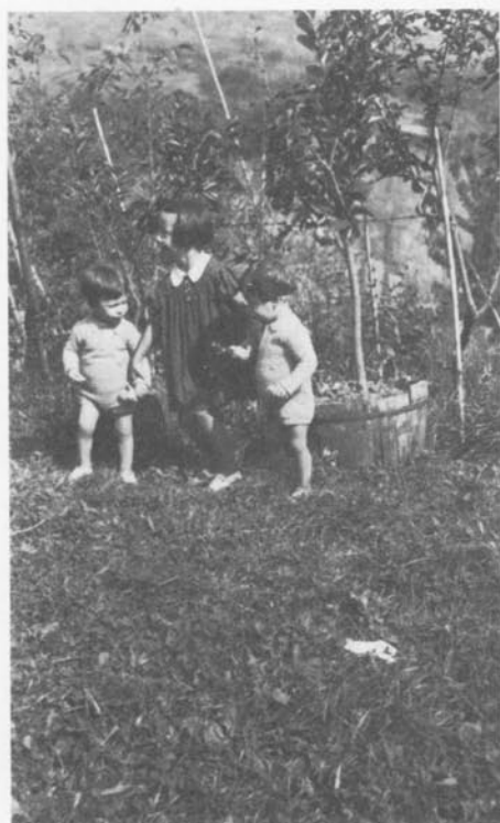
Una rara foto di Mario e Aldo Andretti con la sorella Anna Maria (settembre 1941).