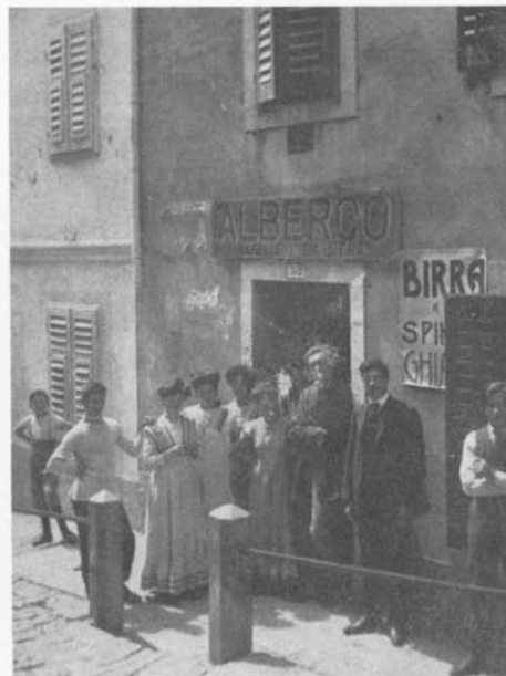
L'Albergo "All'Aquila Nera" ai tempi della... defunta.