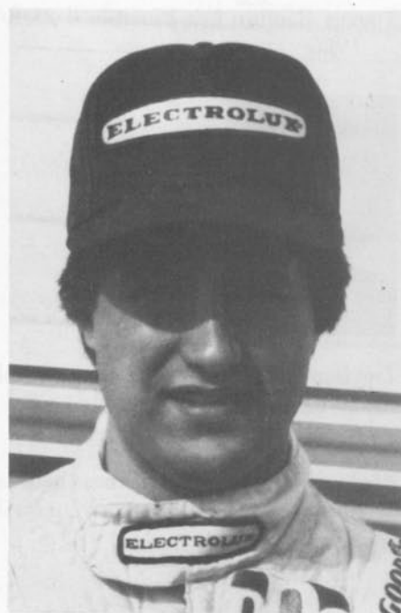
Michael e Jeffrey Andretti - figli di Mario