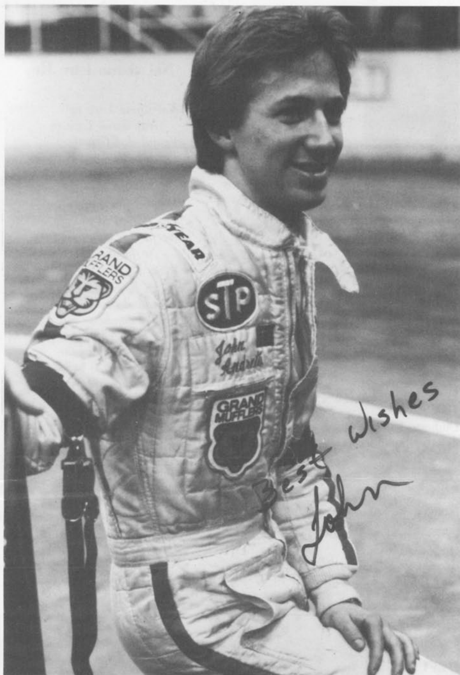
John Andretti - figlio di Aldo