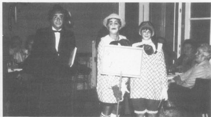
Serata Montonese 1984 Il simpatico gruppo de "La scuola elementare di Montona".

Sabato 25 gennaio 1986 alle ore 21 nella Casa Madre di via S. Pellico 2 a Trieste.