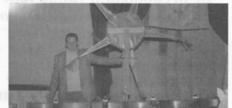
Foto n. 8 - Natale 1984 - Presidente della "Famiglia" fa la relazione annuale.