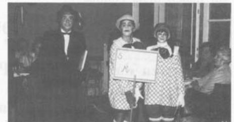
Foto n. 7 - Serata Montonese - Il simpatico gruppo della "Scuola Elementare di Montona"

La Famiglia Montonese e le "4 Ciacole" porgono felicitazioni et auguri vivissimi.