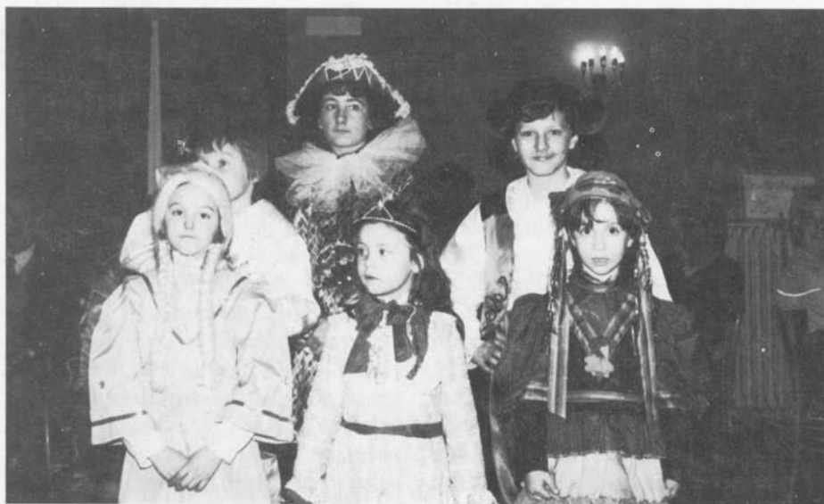
Piccole maschere alla «Serata Montonese».