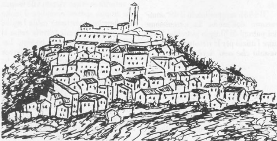
Montona da una stampa del 1700.

Ed oh! il loro esempio ritrovi un emulatore in ognuno dei nostri e dei loro fratelli italiani; i loro sentimenti un'eco in ogni anima cortese, in ogni sensibile core.