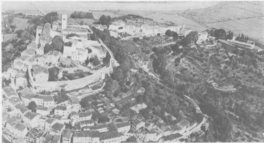
Foto panoramica: Montona dall'alto (da una cartolina in vendita a Montona)