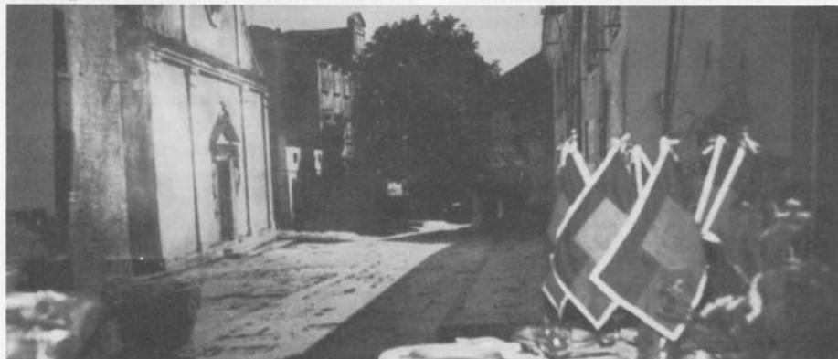
Una tavola imbandita ed una finestra che da sulla gigantografia donata da Tullio Decastello.