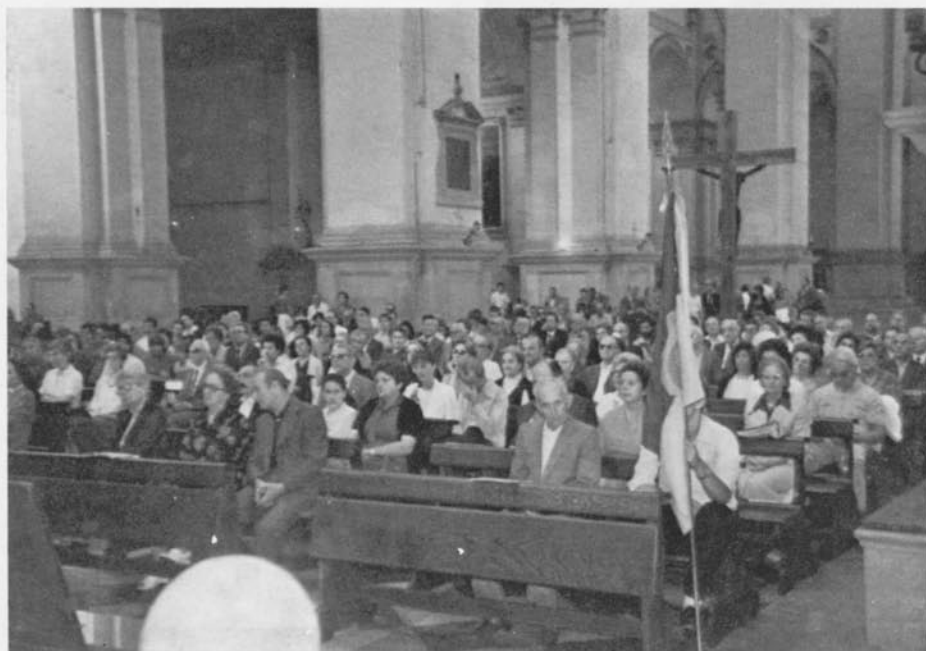
1 In chiesa di S. Giustina con la bandiera.