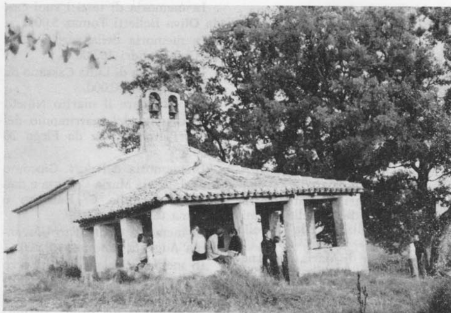
La chiesa della Madonna a Subiente