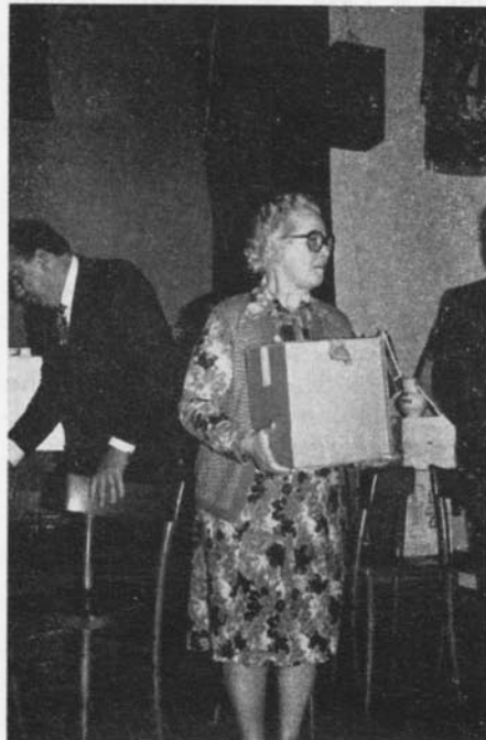
Bartol in Giovaneelli II classificata