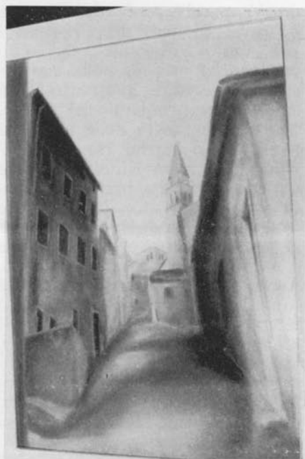
La chiesa della Madonna delle Porte

Ecco che questo somarello fa tornare alla mente tutto il nostro mondo e quella continua osmosi che c'era tra il Paese e le Ville, una collaborazione che durava da sempre, penso per lo meno da quando gli antichi romani mura-