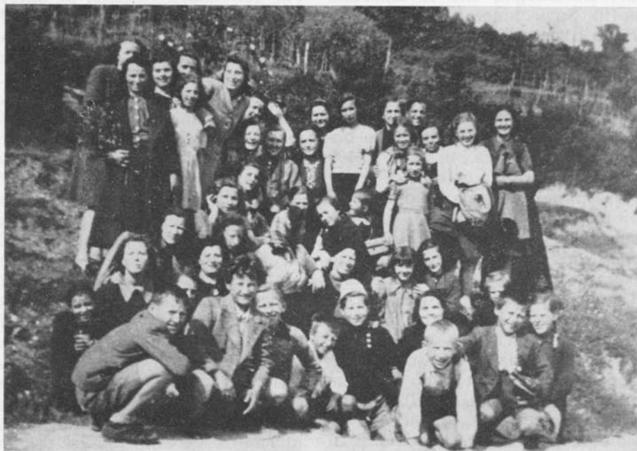
8 settembre 1943 - Un gruppo di montonesi diretti a Subiente