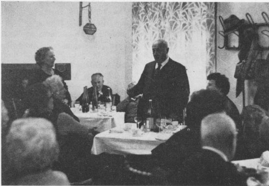
Dopo il caffè con la grappa «la cantada»

Madonna in cartapesta del S. Sansovino che abbiamo potuto ammirare, oltre ai magnifici giardini e alle ville della città. Alcune ore passate al minigolf e al lago di Tarzo hanno chiuso l'ultima «trasferta» per il 1978.