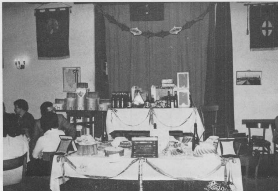
I «pan de Spagna» e i regali per la lotteria