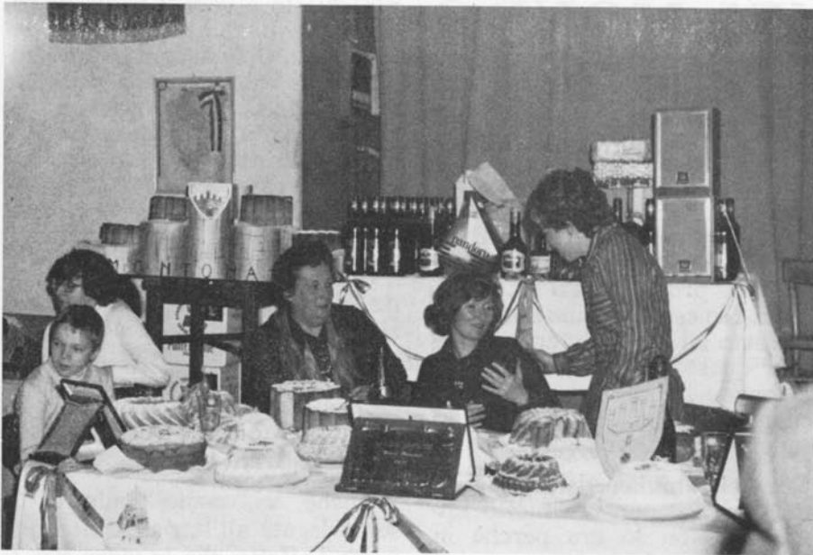
Le signore della giuria discutono dopo «l'assaggio»