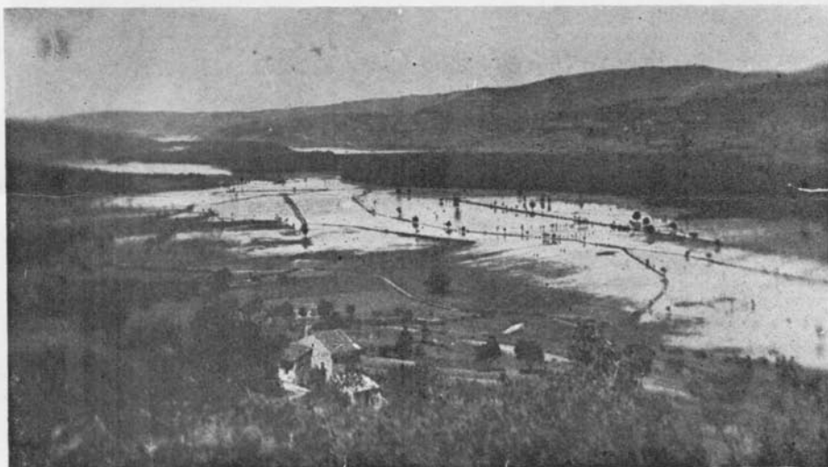
La valle del Quietto in autunno.