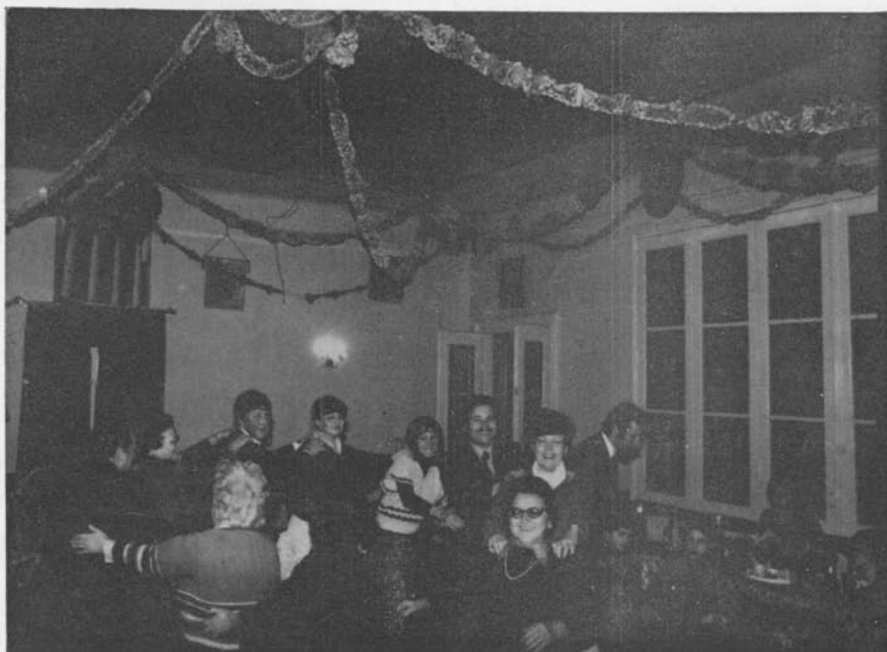
Un piccolo girotondo in attesa della lotteria.