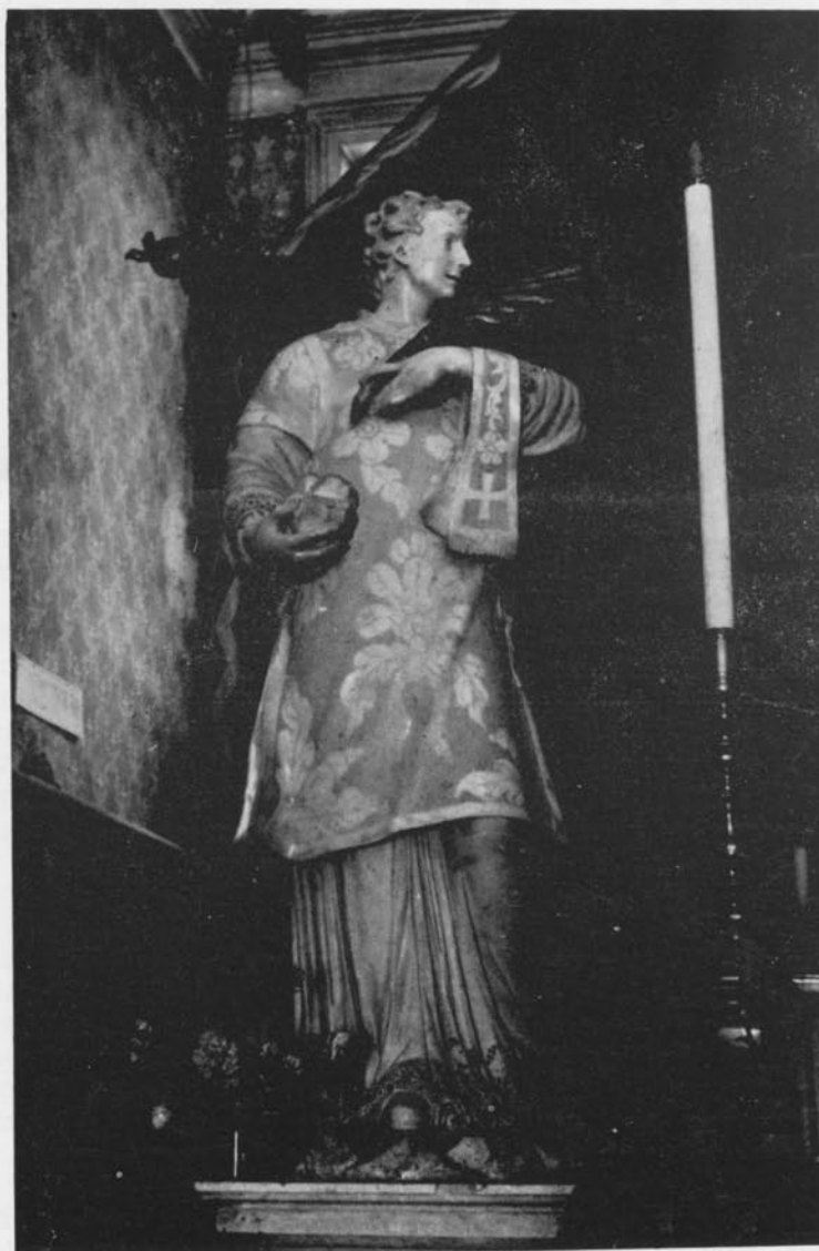
Chiesa di S. Stefano. - Statua di S. Stefano.

Secondo la tradizione, le sue reliquie sarebbero state scoperte per rivelazione e trasportate prima a Sion, 415, indi a Costantinopoli; nel 1110 furono rapite di nascosto da Pietro, priore veneto, che le trasportò a Venezia e le depose nella chiesa di S. Giorgio Maggiore.