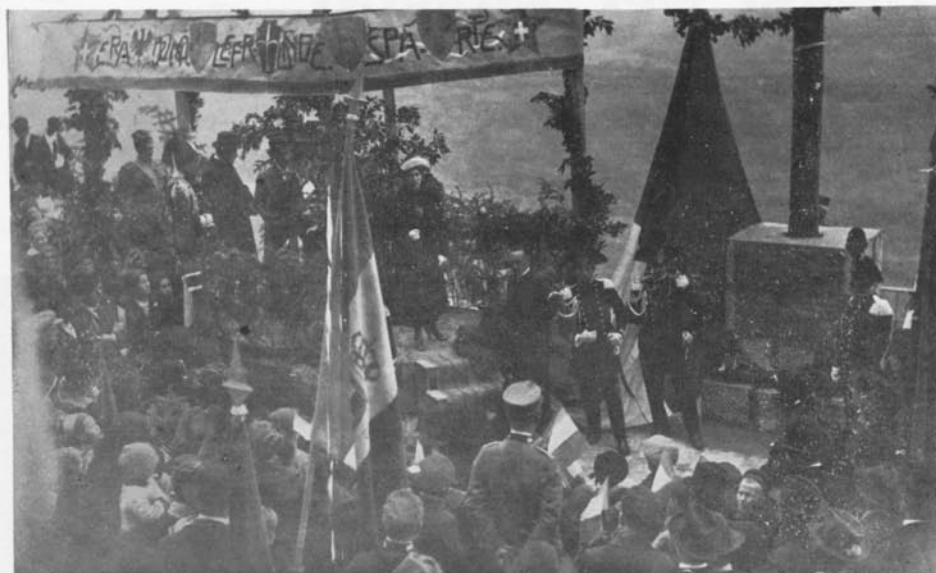
Montona 1922 - Inaugurazione del Pilo per la bandiera