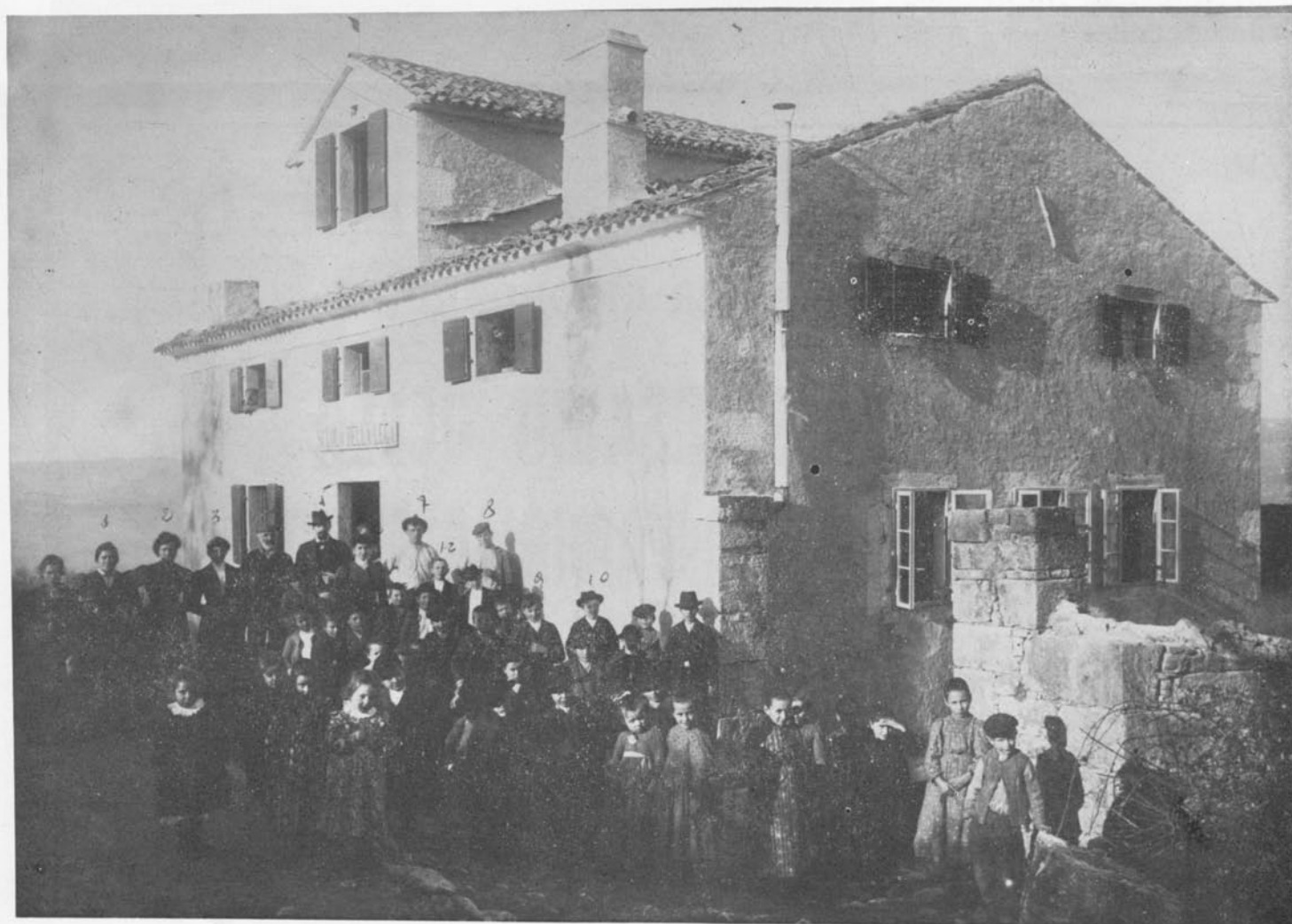
S. Pancrazio di Montona - 1907 - Inaugurazione della scuola della Lega Nazionale