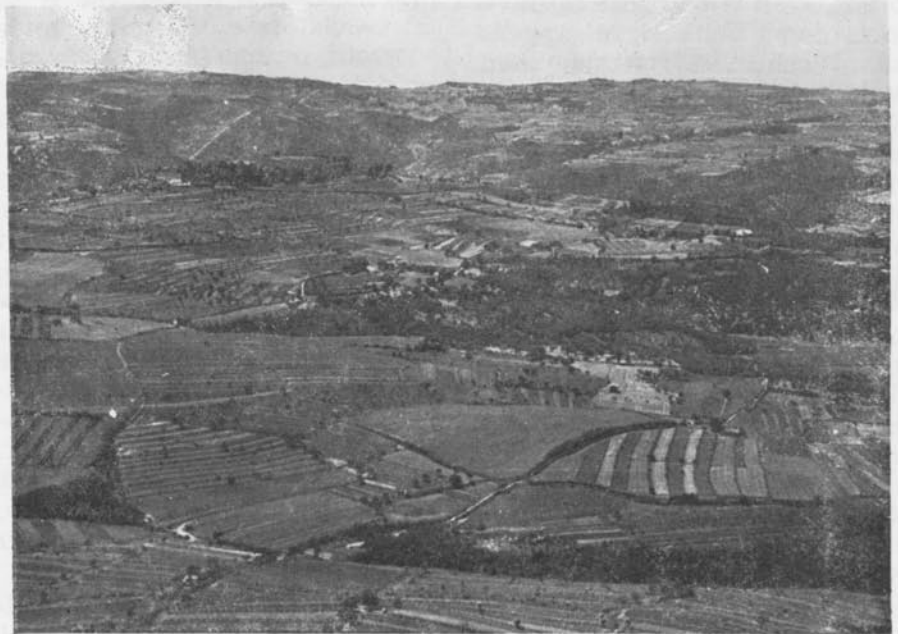
I campi grandi di Polesini

Nel Comune di Montona i cacciatori erano in media 20-22. Cercherò di nominarne alcuni, partendo da lontano: ricordo il