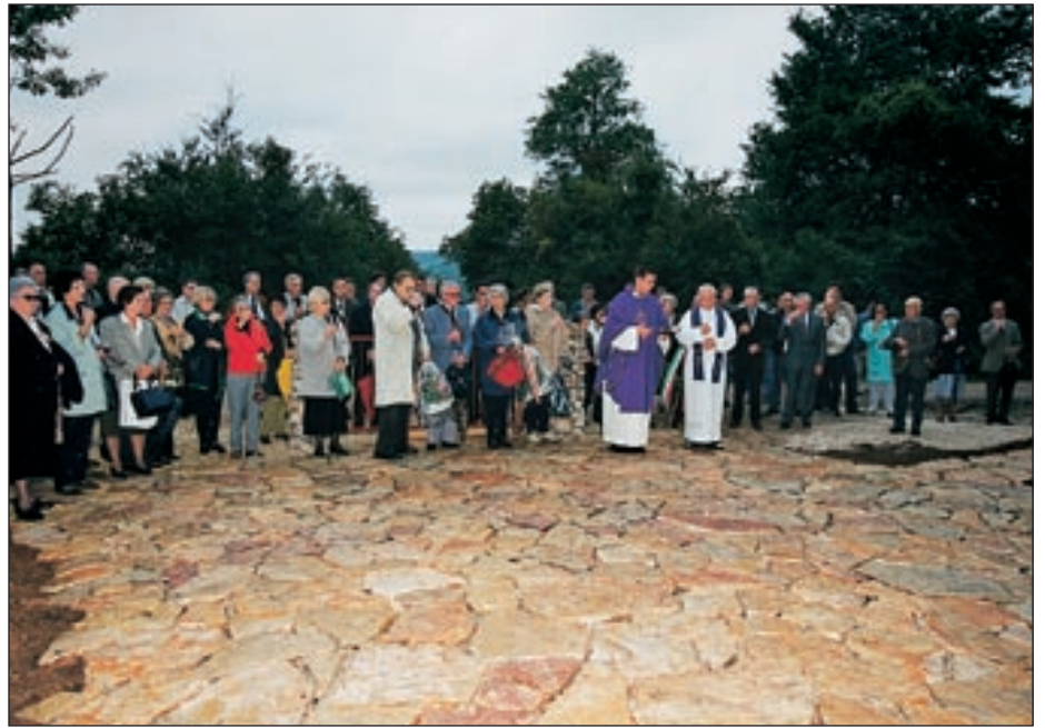
22 settembre 2001 - Benedizione del Sacrario di Cava Cise

A cura della “Famiglia Montonese” venne data notizia della triste scoperta ad ONORCADUTI, la sezione del Ministero della Difesa italiano che si occupa, tra l'altro, della riesumazione dei resti dei soldati italiani caduti in territorio straniero. Purtroppo la risposta è stata