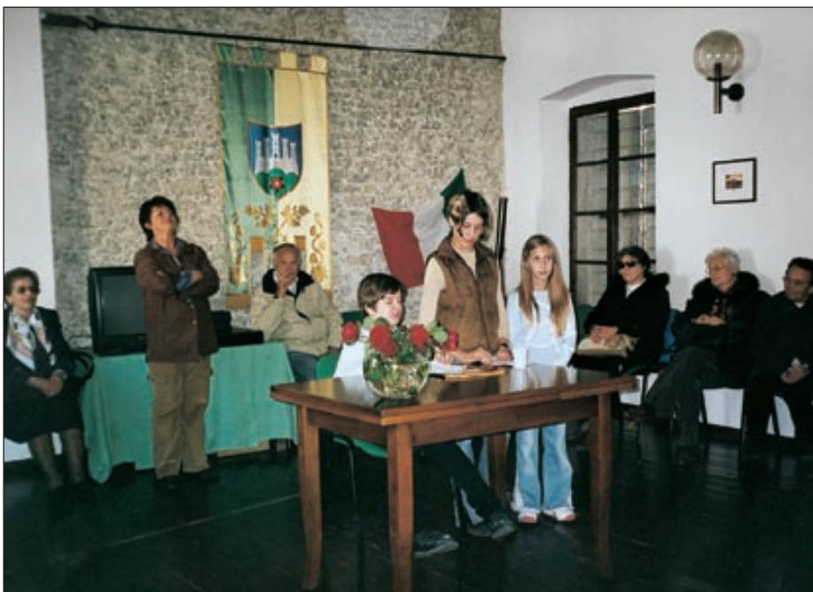
Un momento della recita organizzata nella sede della Comunità Italiana di Montona

Anche in questo caso desideriamo esprimere un profondo ringraziamento per il calore e la sensibilità riservata ai Montonesi durante questa giornata.