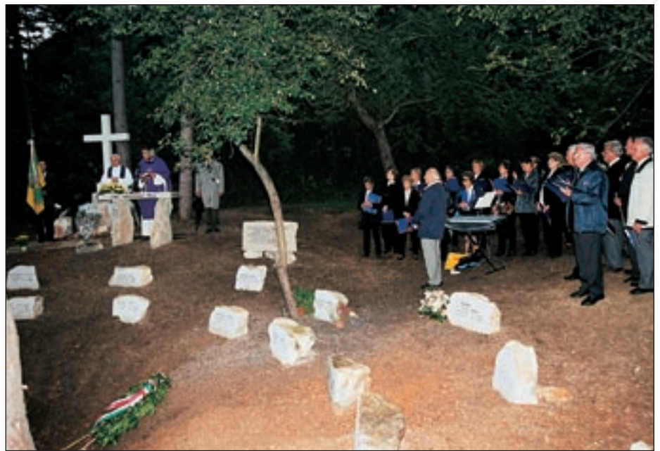
22 settembre 2001 - Santa Messa accompagnata dal coro Arupinum