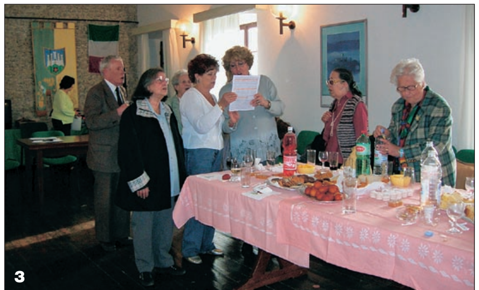
Foto 3: Ritrovo nella sede dalla comunità degli italiani a Montona