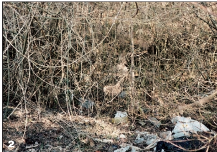
Foto 1, 2, 3, 4: Cava Cise come era in origine e come è stata trasformata in Sacratio

Altre 7 o 8 persone di cui non si conosce l'identità.